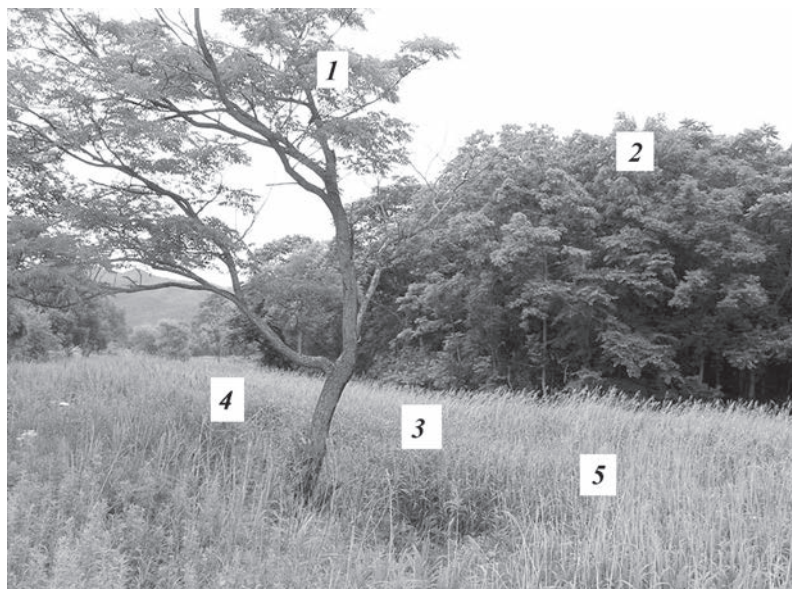
Рис. 3. Территория восточной камышевки высокого качества: песенные посты и гнезда одного из тригамных самцов. 1, 2 – песенные посты на деревьях; 3–5 – гнезда в тростнике

более сомкнутый, не гнездятся, несмотря на встречающиеся там массивы очень хорошо развитого тростника. Оптимальные местообитания для восточной камышевки – поля высокого густого тростника без примеси другой травянистой и кустарниковой растительности, примыкающие к опушке пойменного леса. Здесь раньше всего формируются самые плотные поселения; основные песенные и наблюдательные посты самцов располагаются на деревьях (чозения, амурский бархат, ольха) на высоте до 5–7 м над землей (рис. 3). Позже восточные камышевки заселяют и другие участки тростника, в первую очередь с примесью подроста кленов, а затем и чахлый редкий тростник, густо заросший крапивой, лабазником и другими травами. Эти местообитания так же, как и узкие бордюры кустарников и разнотравья лишь с отдельными фрагментами тростника, можно считать пессимальными. Как правило, в них поселяются лишь одиночные, поздно прибывшие самцы. Максимальная плотность в оптимальных местообитаниях достигает 8 территорий на 1 га. Что же касается общей плотности изученной популяции, то она составляет примерно 10 территориальных самцов на 1 км 2 .