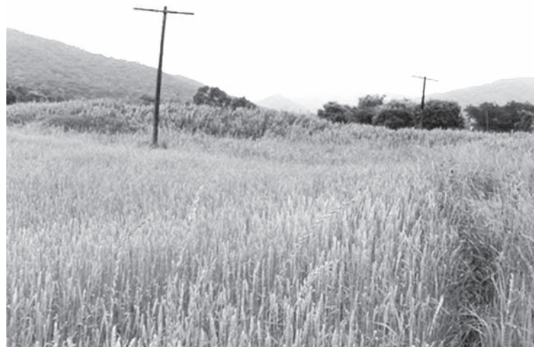
Рис. 2. Местообитания восточных камышевок – агрокультурный ландшафт в долине р. Литовка (Южное Приморье)

В широкой долине р. Литовка и ее многочисленных притоков восточные камышевки заселяют практически все участки тростника, но в боковых, более узких ответвлениях долины (отроги хребтов Чандолаз, Лозовый и Ливадийский), где пойменный лес